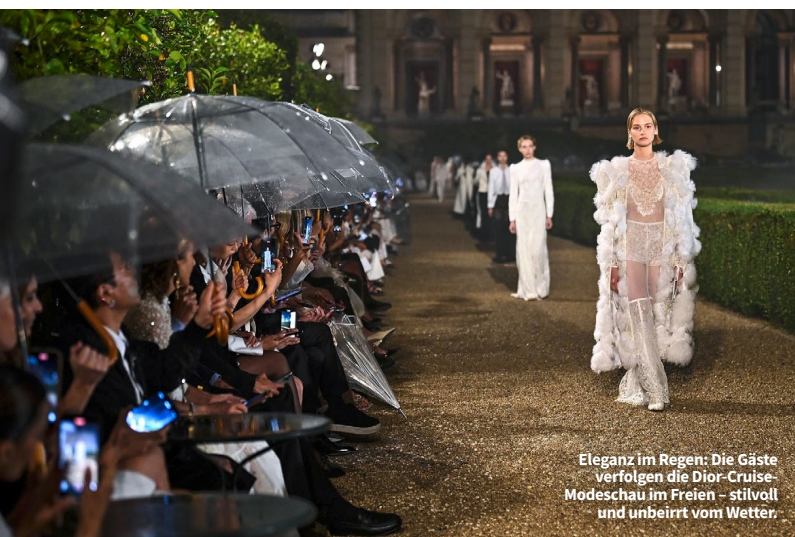
Eleganz im Regen: Die Gäste verfolgen die Dior-Cruise-Modeschau im Freien – stilvoll und unbeirrt vom Wetter.

Nasse Köpfe, weisse Roben: Im Regen von Rom zeigt Dior in der Villa Albani Torlonia seine Cruise-Kollektion 2026 – die letzte unter Kreativdirektorin Maria Grazia Chiuri, 61. Die Looks, inspiriert vom italienischen Kino, reichen von alltags-tauglichen Kreationen bis zu inszenierter Couture. Umgesetzt wurde die Kollektion gemeinsam mit dem römischen Kostümatelier Tirelli. Am Ende der Show erntet Chiuri Standing Ovationen. Wenig später verkündet sie ihren Rücktritt: «Ich bin dankbar für die Arbeit, die meine Teams und die Ateliers geleistet haben», sagt die Italienerin. Als erste Frau an der kreativen Spitze des 1946 gegründeten Hauses verband sie Handwerkskunst mit feministischer Haltung. Ihr Nachfolger? Der nordirische Designer Jonathan Anderson, 40. vn