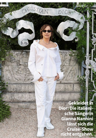
Gekleidet in Dior: Die italienische Sängerin Gianna Nannini lässt sich die Cruise-Show nicht entgehen.