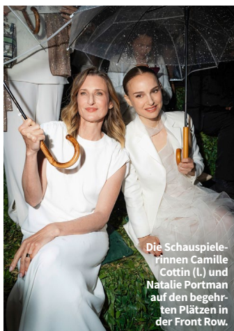
Die Schauspielerinnen Camille Cottin (l.) und Natalie Portman auf den begehrten Plätzen in der Front Row.